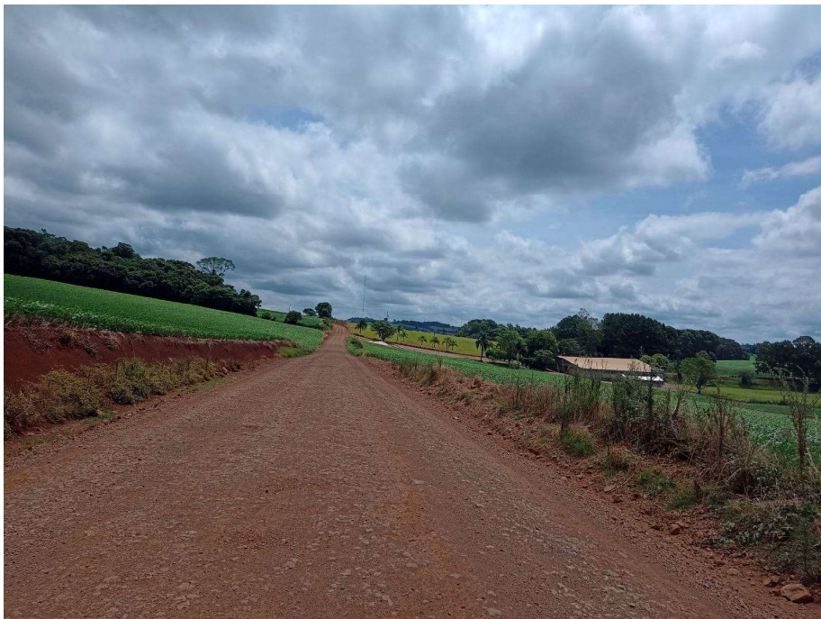
Foto 06 - localizada entre P1 e P2 - Lat. 28° 5' 41,38" S / Lon. 52° 4' 26,82" O