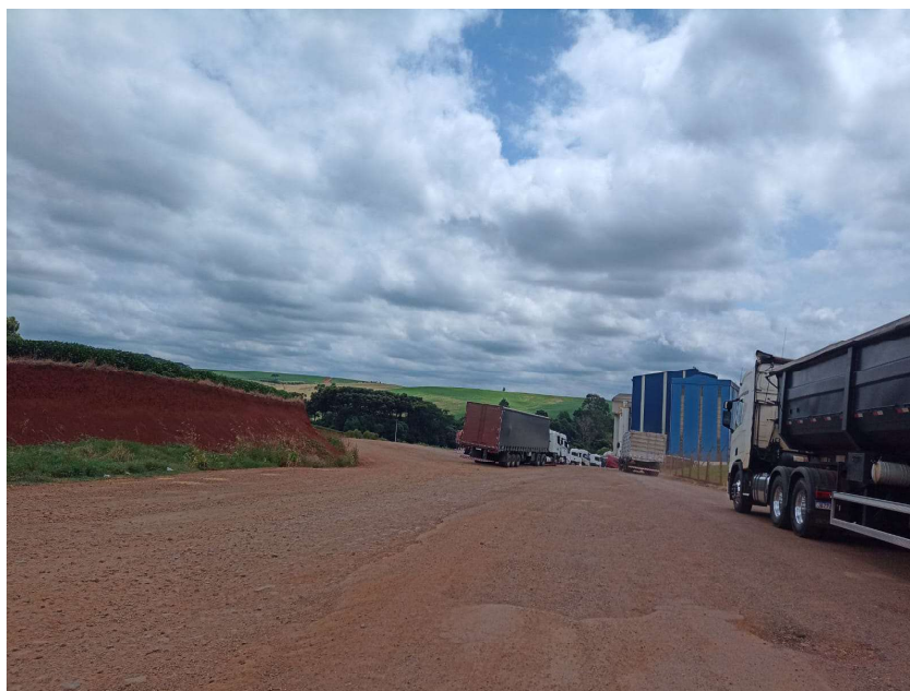
Foto 01 - localizada no P1 - Lat. 28° 5' 36,68" S / Lon. 52° 3' 50,70" O

O Departamento de Engenharia da Prefeitura Municipal de Tapejara, representado pelo Engenheiro Civil José Luiz Marsilio CREA-RS 181378, vem por meio deste apresentar o relatório fotográfico do trecho que está sendo pleiteada a recuperação e cascalhamento da estrada localizada na Linha Caravaggio, conforme se apresentado à seguir: