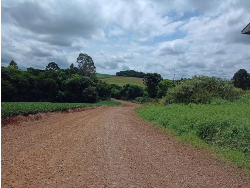
Foto 03 - localizada entre P1 e P2 - Lat. 28° 5' 41,33" S / Lon. 52° 3' 59,55" O