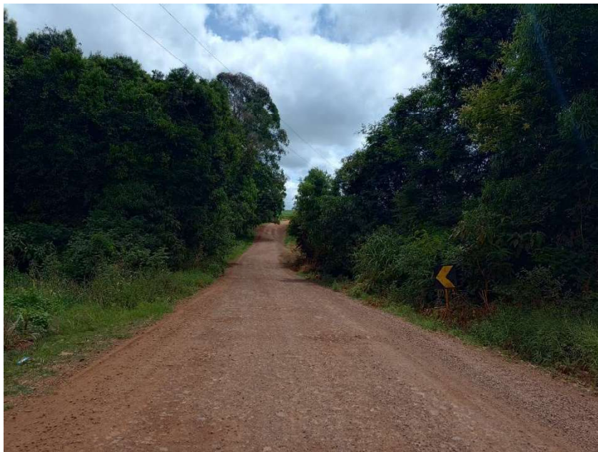
Foto 04 - localizada entre P1 e P2 - Lat. 28° 5' 40,99" S / Lon. 52° 4' 3,28" O