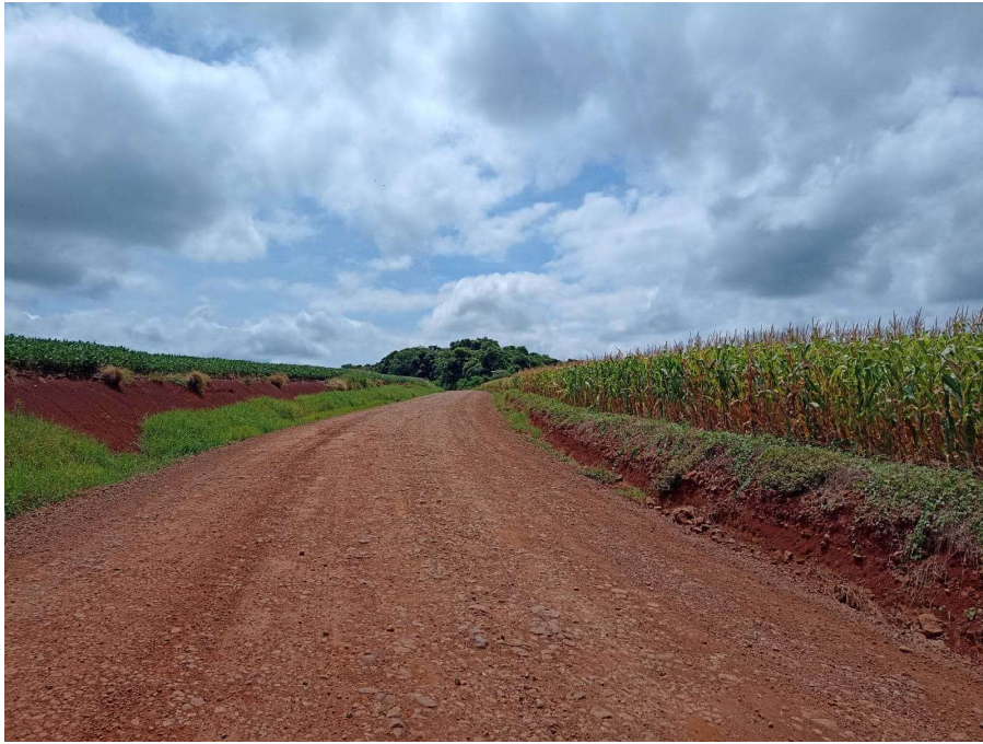
Foto 05 - localizada entre P1 e P2 - Lat. 28° 5' 41,98" S / Lon. 52° 4' 9,61" O