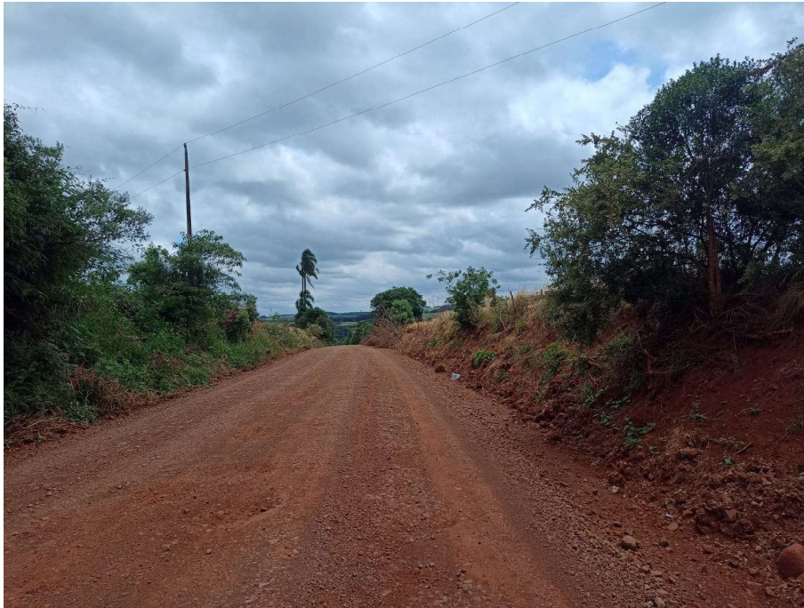
Foto 07 - localizada entre P1 e P2 - Lat. 28° 5' 45,04" S / Lon. 52° 4' 41,45" O