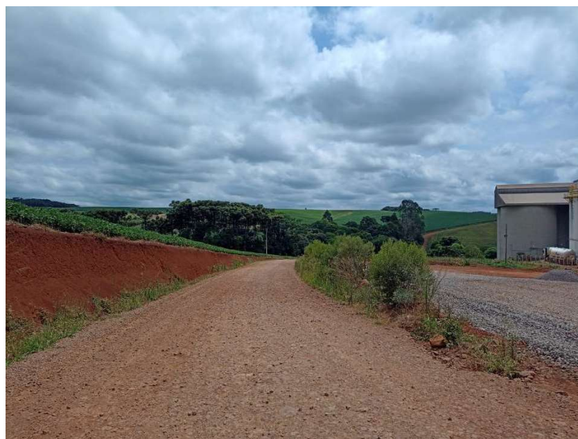
Foto 02 - localizada entre P1 e P2 - Lat. 28° 5' 39,21" S / Lon. 52° 3' 53,65" O