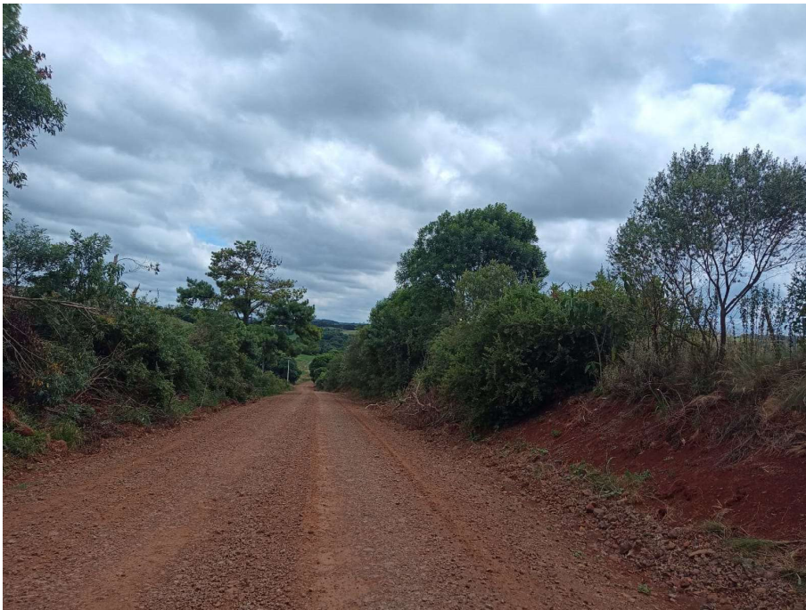
Foto 08 - localizada entre P1 e P2 - Lat. 28° 5' 49,64" S / Lon. 52° 4' 47,37" O