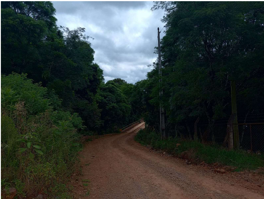
Foto 10 - localizada no P2 - Lat. 28° 5' 57,90" S / Lon. 52° 4' 59,54" O