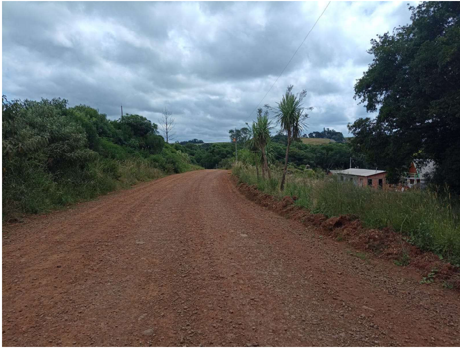
Foto 09 - localizada entre P1 e P2 - Lat. 28° 5' 56,84" S / Lon. 52° 4' 56,92" O