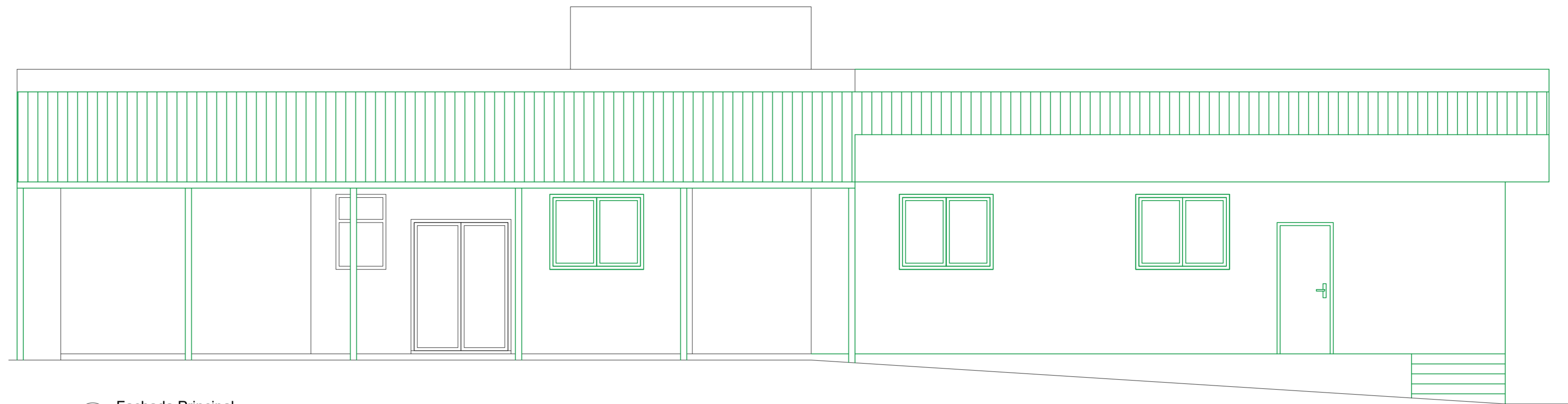
2 Fachada Principal 1:50